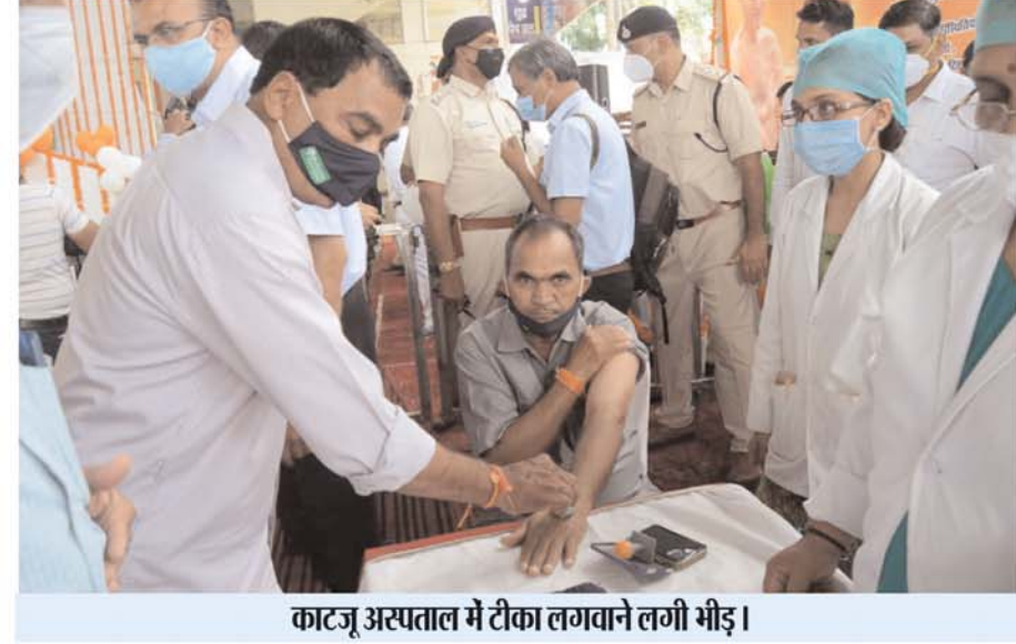
काटजू अस्पताल में टीका लगवाने लगी भीड़।

भोपाल (निर्स)। कोविड-19 वैक्सिनेशन महा अभियान के पहले दिन जिले में कुल 704 केन्द्रों एवं मोबाईल टीम के माध्यम से वैक्सिनेशन पूरे उत्साह से जारी रहा। मुख्यमंत्री शिवराज सिंह चौहान ने अभियान के पहले दिन जवाहर चौक स्थित जैन मंदिर वैक्सिनेशन केन्द्र पर राज्यस्तरीय अभियान को शुरूआत की। मुख्यमंत्री चौहान बाद में काटजू अस्पताल स्थित केन्द्र गए और वहां की व्यवस्थाओं का जायजा लिया। उन्होंने अनेक टीकाकृत व्यक्तियों को प्रमाण पत्र