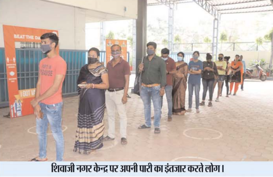
शिवाजी नगर केन्द्र पर अपनी पारी का इंतजार करते लोग।