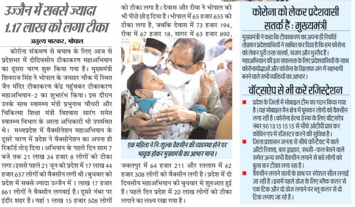
एक महिला ने निःशुल्क वैक्सीन की व्यवस्था होने पर भावुक होकर मुख्यमंत्री का आभार माना।

21,34,000 को सेहत का टीका उज्जैन में सबसे ज्यादा 1.17 लाख को लगा टीका अतुल्य भास्कर, भोपाल कोरोना संक्रमण से बचाव के लिए आज से प्रदेशभर में दोदिवसीय टीकाकरण महाअभियान का दूसरा चरण शुरू किया गया है। मुख्यमंत्री शिवराज सिंह ने भोपाल के जवाहर चौक में स्थित जैन मंदिर टीकाकरण केंद्र पहुंचकर टीकाकरण महाअभियान-2 का शुभारंभ किया। इस दौरान उनके साथ स्वास्थ्य मंत्री प्रभुनाथ चौधरी और चिकित्सा शिक्षा मंत्री विश्वास सारंग समेत स्वास्थ्य विभाग के आला अधिकारी भी उपस्थित थे। मध्यप्रदेश में वैक्सिनेशन महाअभियान के दूसरे चरण में प्रदेश ने वैक्सिनेशन का अपना ही रिकॉर्ड तोड़ दिया। अभियान के पहले दिन शाम 7 बजे तक 21 लाख 34 हजार 8 लोगों को टीका लगा। इससे पहले 21 जून को प्रदेश में 17 लाख 44 हजार 657 लोगों को वैक्सिन लगी थी। बुधवार को प्रदेश में सबसे ज्यादा उज्जैन में 1 लाख 17 हजार 861 लोगों ने वैक्सिन लगावाई है। दूसरे नंबर पर इंदौर शहर है। यहां 1 लाख 15 हजार 508 लोगों को टीका लगा है। देवास और रीवा ने भोपाल को भी पीछे छोड़ दिया है। भोपाल में 65 हजार 655 को टीका लगा है, जबकि देवास में 73 हजार 194, रीवा में 67 हजार 18, सागर में 63 हजार 890, जबलपुर में 64 हजार 211 और रतलाम में 62 हजार 308 लोगों को वैक्सिन लगी है। प्रदेश में दो दिवसीय महाअभियान की बुधवार से शुरुआत हुई है। पहले दिन प्रदेश में 20 लाख लोगों को टीका लगाने का लक्ष्य रखा गया है।