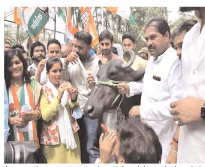
बावजूद प्रदेश सरकार लगातार बिजली के रेट बढ़ा रही है। भोपाल में कई उपभोक्ताओं को गलत रीडिंग के बढ़े हुए बिल भी दिए जा रहे हैं। इसके चलते ऊर्जा